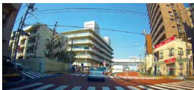
フロントカメラ映像

前と後ろにカメラレンズが搭載されているので、車の前方と車内を同時に撮影できるドライブレコーダーです。フロントカメラは解像度 1440×1080、リアカメラは解像度 1280×720。高画質高圧縮の H.264 を採用。WDR (ワイドダイナミックレンジ) 搭載。車のナンバープレートもはっきりと認識できるクリアな映像を記録できます。また赤外線 LED ライトはリアカメラのみ 4 灯搭載ですが、高画質なので、街中などではライトが必要ないぐらいにキレイな映像を撮影する事が出来ます。