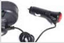
GPS シガーソケット 付きモデル