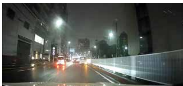
フロントカメラ映像