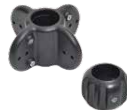
アタッチメント 2 種類付属

状況に応じてご利用いただけるように、多数のオプションカメラ・アタッチメントをご用意しております。