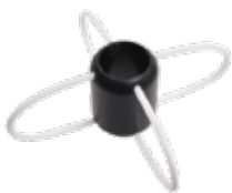
先端カバーアタッチメント 140mm 型番：HANDOOP1 ¥3,480 (税込)