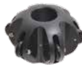
ローラー付き先端カバーアタッチメント90mm 型番：HANDOOP3 ¥5,780 (税込)