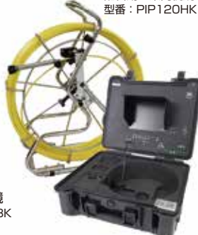
配管用工業内視鏡カメラシステム120M 型番：PIP120HK