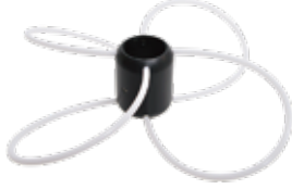
先端カバーアタッチメント 220mm 型番：HANDOOP2 ¥4,680 (税込)