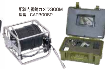
配管内視鏡カメラ300M 型番：CAP300SP