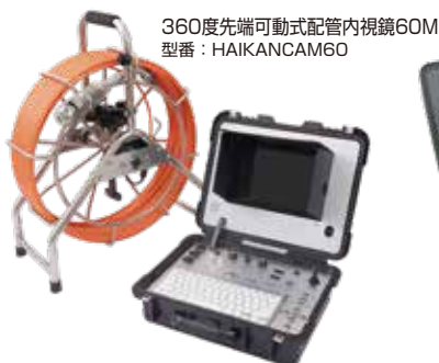
360度先端可動式配管内視鏡60M 型番：HAIKANCAM60