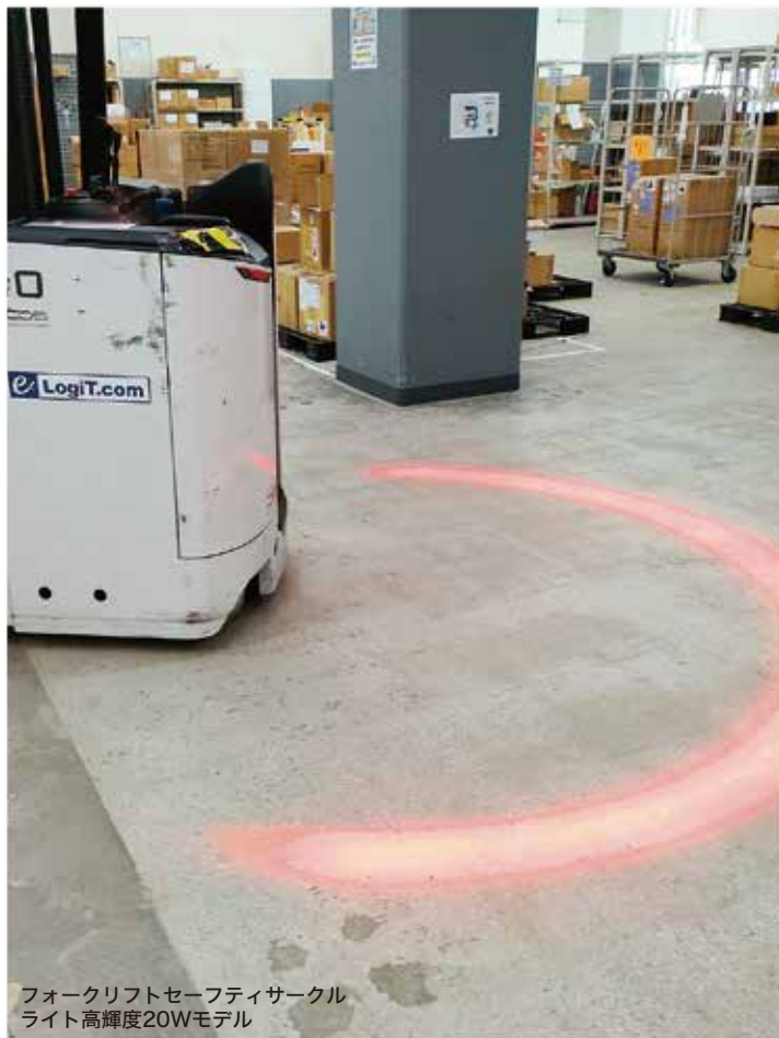
フォークリフトセーフティサークル ライト高輝度20Wモデル