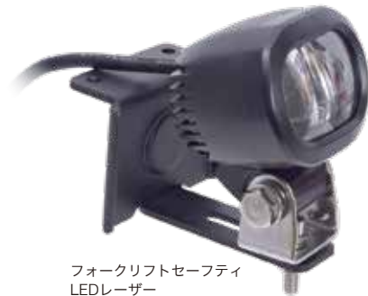
フォークリフトセーフティ LEDレーザー