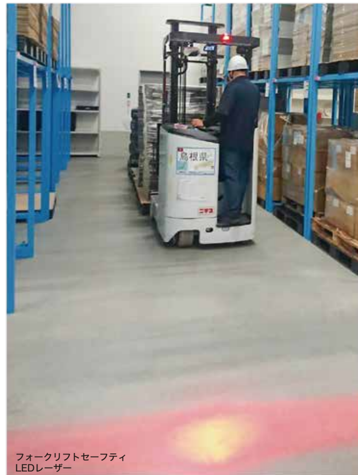
フォークリフトセーフティ LEDレーザー

フォークリフトによる事故のうち約66%が接触事故となっています。フォークリフトでの作業中、多数の荷物や作業音などでフォークリフトの接近に気づけにくい場合、衝突などの事故が起こる可能性が高くなります。そのような事故を未然に防ぐために、赤のラインで注意喚起を促すのが【フォークリフトセーフティLEDレーザー】【フォークリフトセーフティサークルライト高輝度20Wモデル】です。高輝度のLEDライトなので、明るい場所でも赤のラインがしっかりと投影されます。安全対策にぜひご検討ください。