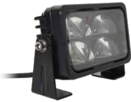
フォークリフトセーフティサークルライト 高輝度20Wモデル