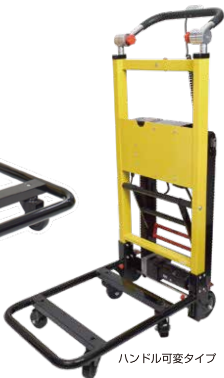
ハンドル可変タイプ