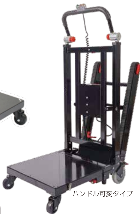
ハンドル可変タイプ