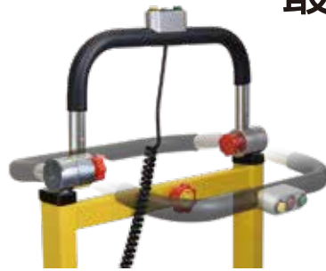
ハンドル可変タイプ