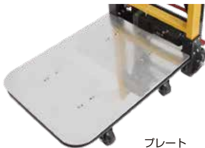
プレート 型番 : ELECTRL3BD 33,800 円 (税込)