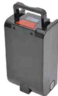
バッテリー 型番 : ELEBATSBK 64,800 円 (税込)